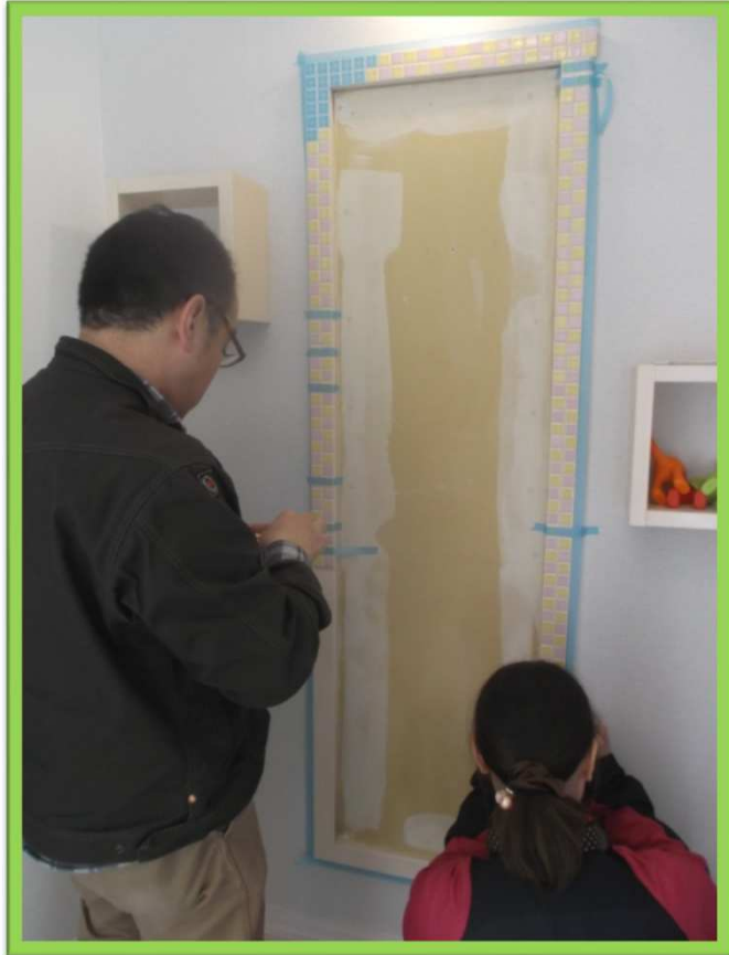
作業員が社長に交代。順調・順調。